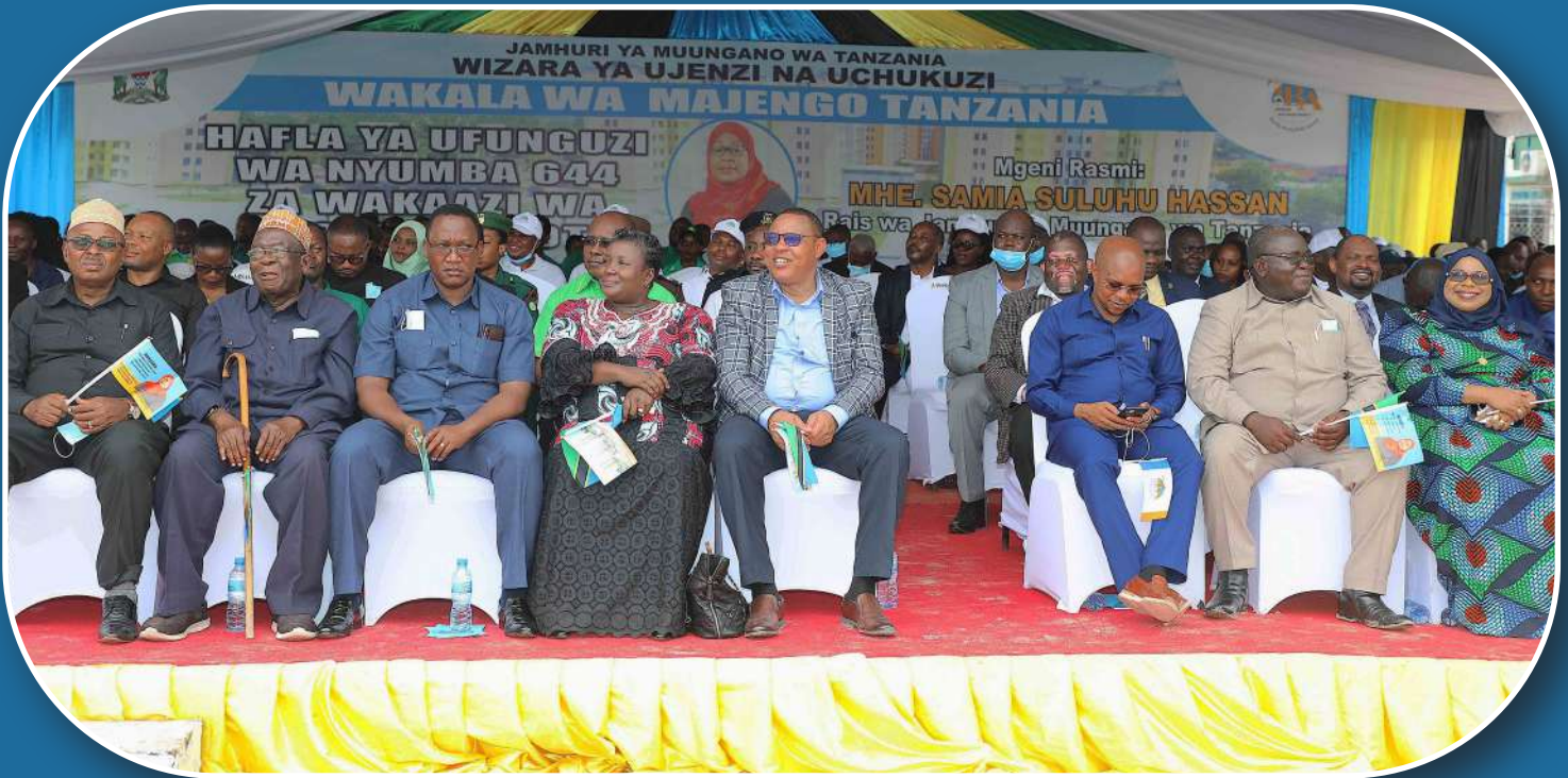
Baadhi ya wageni waalikwa waliohudhuria Hafla ya Ufunguzi wa Nyumba 644 za Makazi za Magomeni Kota .