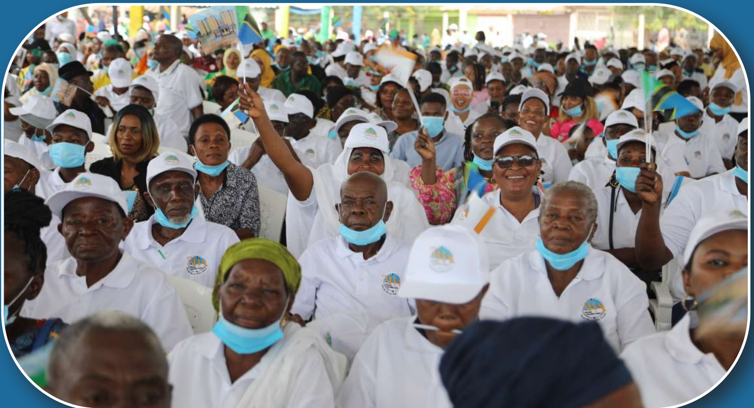
Baadhi ya wakaazi wa Magomeni Kota waliohudhuria Hafla ya Ufunguzi wa Nyumba 644 za Makazi za Magomeni Kota .