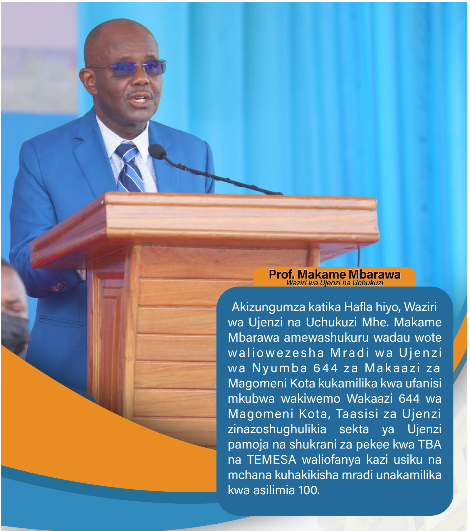
Prof. Makame Mbarawa Waziri wa Ujenzi na Uchukuzi

Akizungumza katika Hafla hiyo, Waziri wa Ujenzi na Uchukuzi Mhe. Makame Mbarawa amewashukuru wadau wote walioweza Mradi wa Ujenzi wa Nyumba 644 za Mkaazi za Magomeni Kota kukamilika kwa ufanisi mkubwa wakiwemo Wakaazi 644 wa Magomeni Kota, Taasisi za Ujenzi zinazoshughulikia sekta ya Ujenzi pamoja na shukrani za pekee kwa TBA na TEMESA waliofanya kazi usiku na mchana kuhakikisha mradi unakamilika kwa asilimia 100.