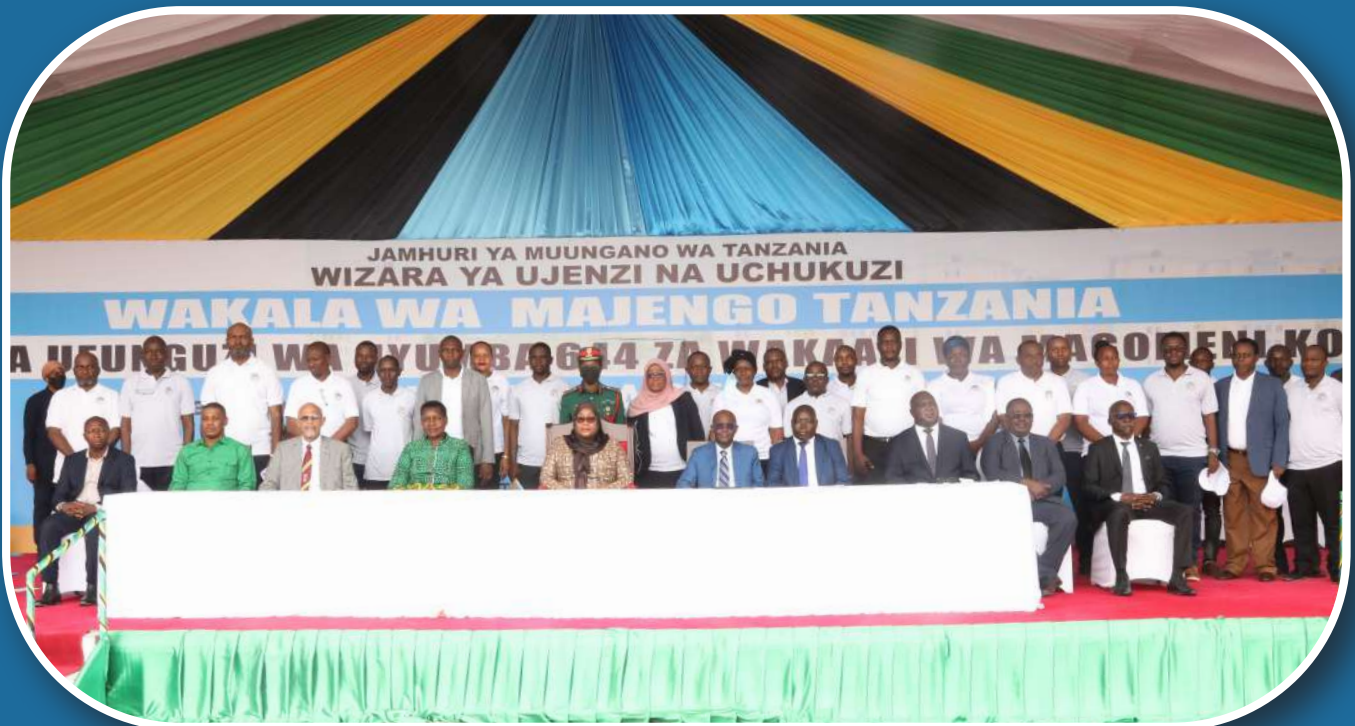
Mhe. Rais Samia Suluhu Hassan akiwa katika picha ya pamoja na sehemu ya menejimenti ya Wakala wa Majengo Tanzania (TBA) wakati wa Hafla ya Ufunguzi wa Nyumba 644 za Makazi za Magomeni Kota .