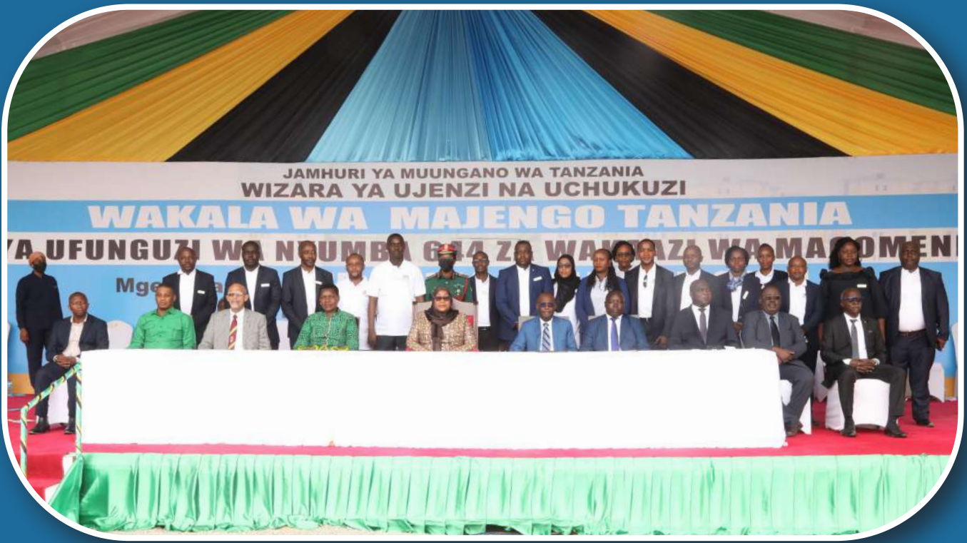
Mhe. Samia Suluhu Hassan , Rais wa Jamhuri ya Muungano wa Tanzania akiwa katika picha ya pamoja na kamati ya maandalizi ya TBA wakati wa Hafla ya Ufunguzi wa Nyumba 644 za Makazi za Magomeni Kota .